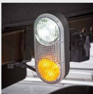
Éclairage LED durable