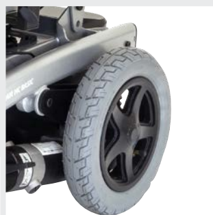
Pneus avec protection contre les crevaisons