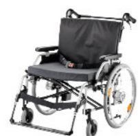
EUROCHAIR² XXL 2.850 PAGE 3