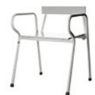
TABOURET DE DOUCHE AVEC ACCOUDOIRS XXL PAGE 9