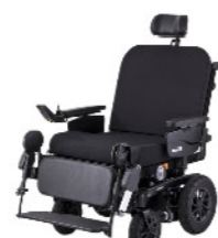
iCHAIR XXL 1.614 PAGE 5