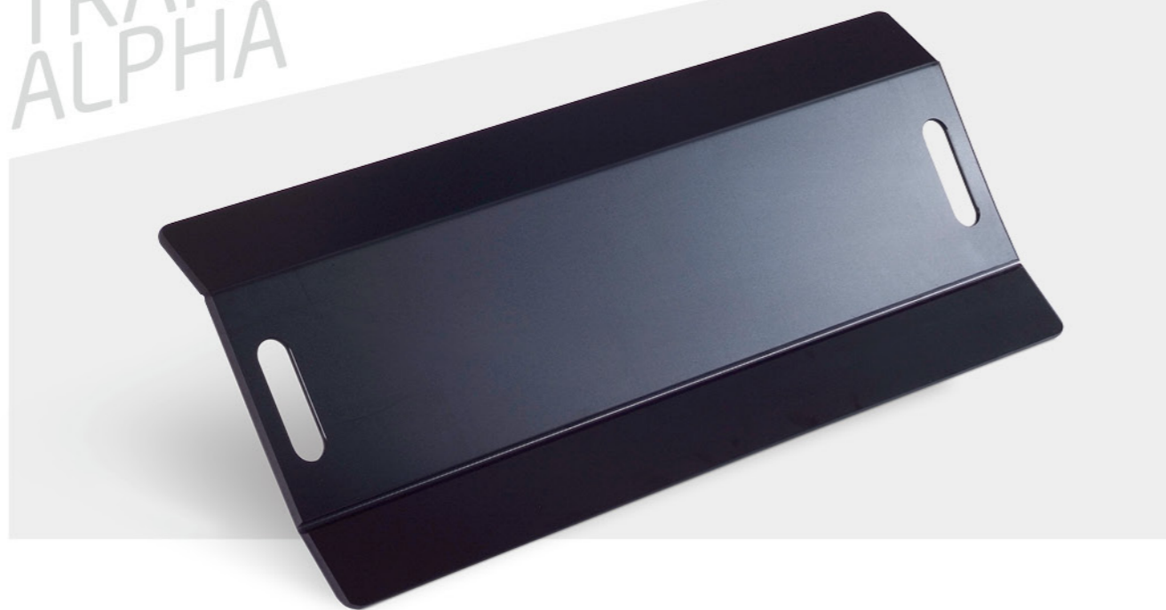
PLANCHE DE TRANSFERT ALPHA

AUTRES PRODUITS ALPHA SOUS WWW.MEYRA.COM