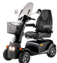
CITYLINER 415 XXL 2.764 PAGE 4