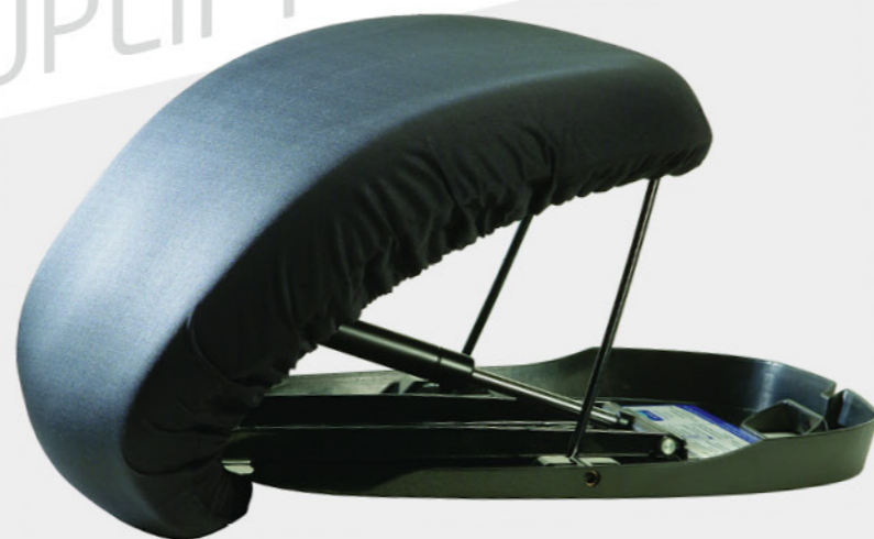
Siège catapulte Uplift