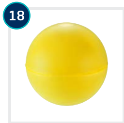
18 CODE 4595