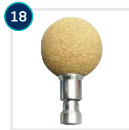
18 CODE 4602/4603