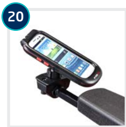
20 CODE 782