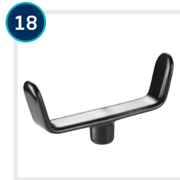
18 CODE 556