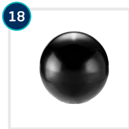
18 CODE 4590