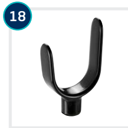
18 CODE 553