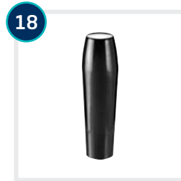
18 CODE 4593