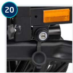
20 CODE 781