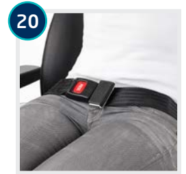
20 CODE 833