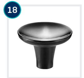
18 CODE 4594