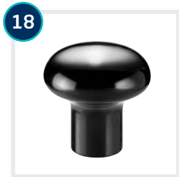
18 CODE 4589