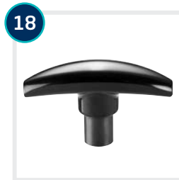
18 CODE 4591