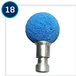
18 CODE 4606/4607