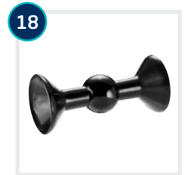
18 CODE 734