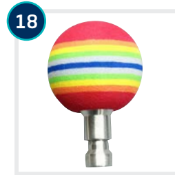
18 CODE 4604/4605