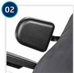
Article 1080610/ 1080612