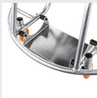
Plaque repose-pieds à réglage individuel