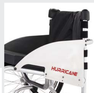
Accoudoirs en aluminium vissés